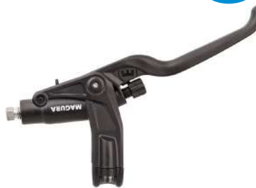
BOMBA FRENO HS33 2 DEDOS