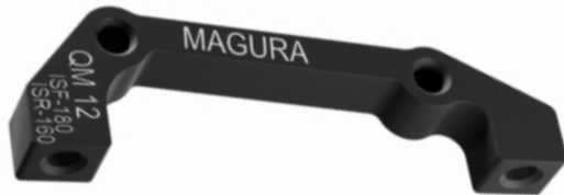
722426 QM12: 180mm IS del, 160mm IS tras.