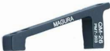
724131 QM26; 203mm PM del.