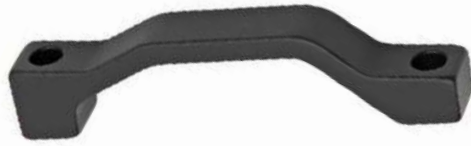
2700515 QM40: 180mm PM