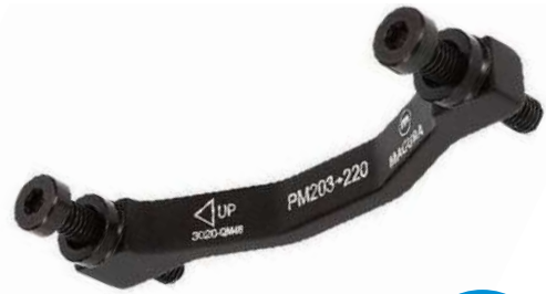
2702193 QM 46 PM 203-220