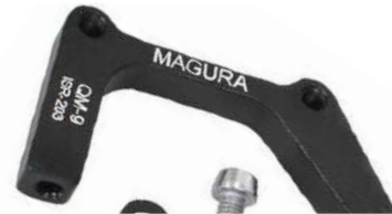
722325 QM9: 203mm IS tras.