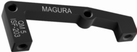
722321 QM5: 203mm IS del.