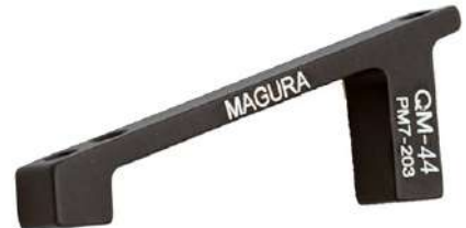
2701967 Adaptador QM44: 180mm - 203PM